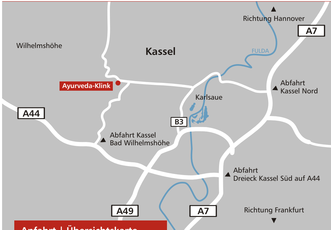
Anfahrt | Übersichtskarte

Telefon 0561 3108-99 Fax 0561 3108-883 E-Mail info@ayurveda-klinik.de Internet www.ayurveda-klinik.de